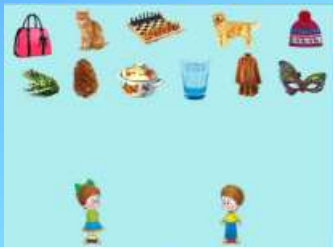
«Картинки Сони и Мише»

дифференциация звуков [С] - [Ш] в словах Количественный и порядковый счет